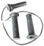
Código : 901600004 000 Desc: MANDO DE GAS CON PUNOS