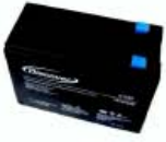
Código : 901600001 000 Desc: BATERIA TR3E