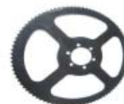
Código : 902000037 000 Desc: CORONA Z=118 TR3E20