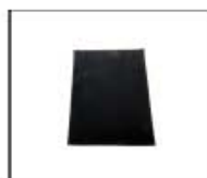
Código : 901600097 000 Desc: ESPUMA BATERIAS TR3E