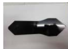
Código : 901600090 001 Desc: ALARGO GUARDABARROS POST. MINI TRIAL E-20 COMPL.