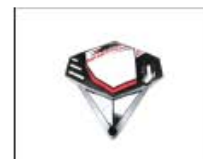
Código : 901600095 000 Desc: PORTAFARO TR3E ( SIN ADHESIVO )