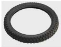
Código : 902000031 000 Desc: NEUMATICO ANTERIOR (CON CAMARA) 20 X 2.0