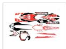
Código : 901600096 000 Desc: KIT ADHESIVOS COMPLETOS TR3E 2014