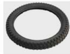
Código : 902000032 000 Desc: NEUMATICO POSTERIOR(CON CAMARA) 20.2.5