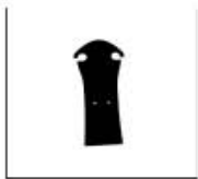
Código : 901600100 000 Desc: PROTECTOR AMORTIGUADOR TR3E