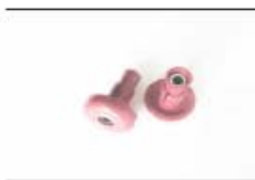
Código : 901600055 000 Desc: TOPES MANILLAR TR3E