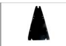
Código : 901600098 000 Desc: PROTECTOR ANTERIOR CHASIS