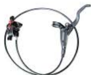
Código : 901600071 000 Desc: CONJUNTO FRENO TRASERO TR3E