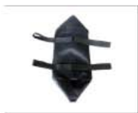
Código : 901600005 000 Desc: FUNDA BATERIAS TR3E