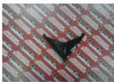
Código : 901600101 000 Desc: TULIPA PORTAFARO ANT. TR3E