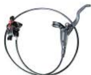
Código : 901600070 000 Desc: CONJUNTO FRENO DELANTERO TR3E