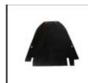
Código : 901600099 000 Desc: PROTECTOR POSTERIOR CHASIS TR3E