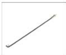
Código : 902000034 001 Desc: KIT RADIOS C/ CABECILLA RUEDA POST.