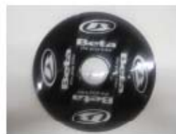
Código : 902000036 000 Desc: ADHESIVO PROTECTOR CORONA MINITRIAL E 20"