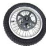
Código : 902000031 002 Desc: RUEDA POST. COMPL.( LLANTA,BUJE,RADIOS)