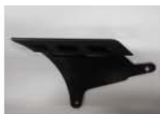
Código : 007330501 059 Desc: CUBRECADENA VTM NEGRO