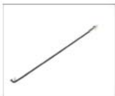
Código : 902000034 000 Desc: KIT RADIOS C/ CABECILLA RUEDA DELANTERA